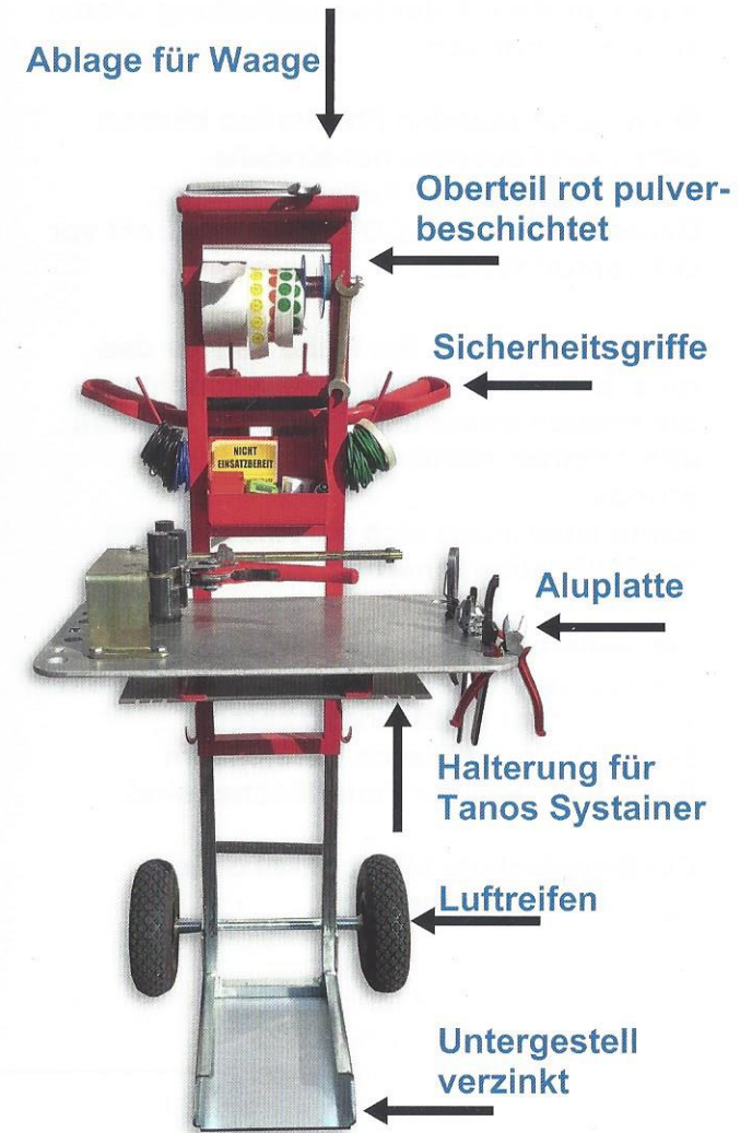
Bild Bestückbeispiel, Werkzeug nicht im Lieferumfang enthalten