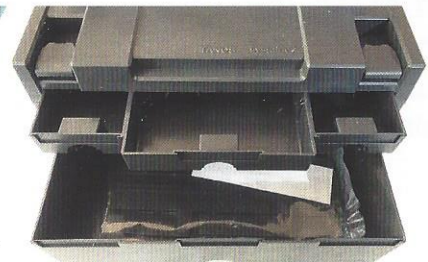
Tanos Systemer für Ersatzteile (Sonderzubehör)