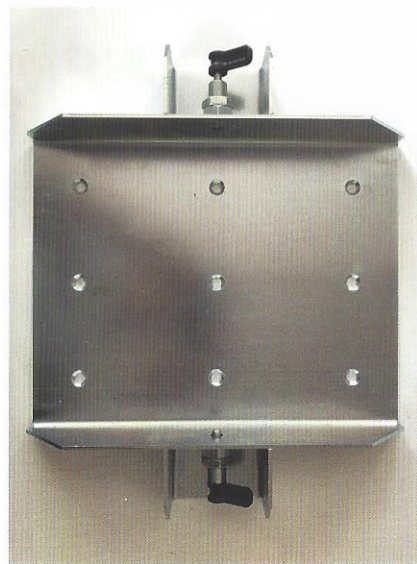
KFZ-Halterung mit Schnellspannverschlüssen Halterung zum sicheren Transport im KFZ (Sonderzubehör)