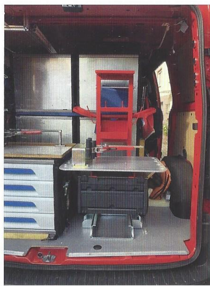
Einbaubeispiel für Ihr Fahrzeug